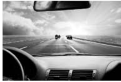
Sonnenbrillengläser mit Polarisation

brillanteres Bild erzeugen. Bei Sonnenschutzgläsern sollte zudem die Rückfläche (dem Auge zugewandte Seite) entspiegelt sein, damit seitlich einfallendes Licht nicht zu störenden Reflexen führt. Eine Entspiegelung auf der Glasvorderseite ist zwar möglich,