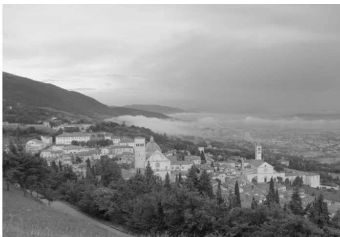
abendliches Assisi (Burkhard Oberle)

Vier Elsenfelder Familien haben sich in der Nacht zum Pfingstmontag auf die Fahrt mit dem Bus nach Assisi begeben. In altersgemäßen Gruppen sind Erwachsene, Kinder und Jugendliche aus dem ganzen Bistum den Spuren der Heiligen Franziskus und Klara gefolgt und haben dabei die wunderschöne mittelalterliche Stadt Assisi kennen gelernt.