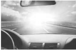
Sonnenbrillengläser ohne Polarisation

Beim Autofahren herrschen oft schwierigste Sichtbedingungen. Besonders bei starker Sonne brauchen die Augen Entlastung. Eine dunkle Tönung allein reicht jedoch nicht. Für den Straßenverkehr sind nur bestimmte Färbungen zugelassen, die die Farben nicht stark verfälschen damit Lichtzeichenanlagen verwechslungssicher erkannt werden können. Am farbneutralsten sind graue Gläser, die jedoch den Himmel leicht gewittig erscheinen lassen. Besonders gut geeignet sind spezielle kontraststeigernde Tönungen, die ein