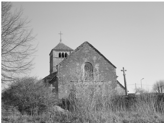
Romanische Kirche in der Nähe des Klosters Taizé